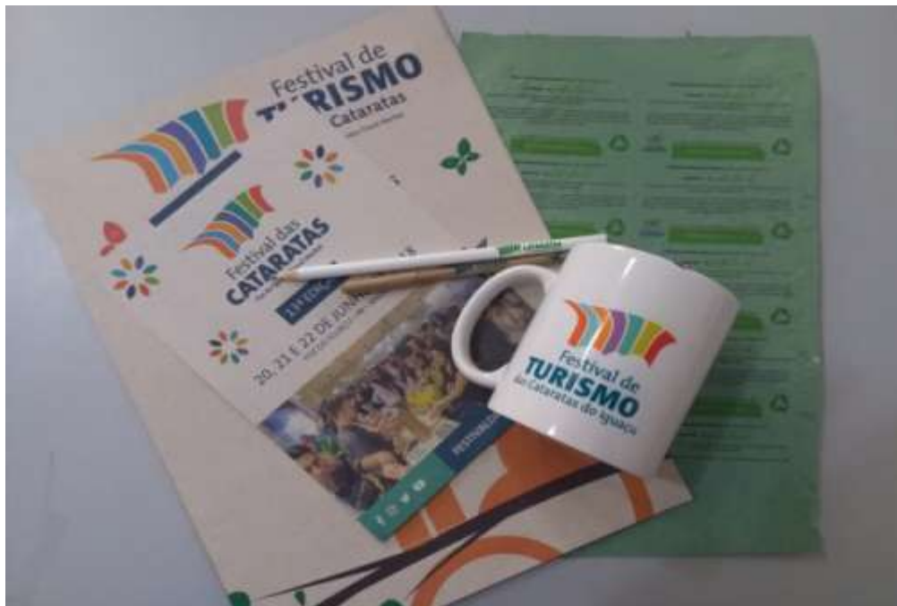
Figura 11 Materiais mais sustentáveis.