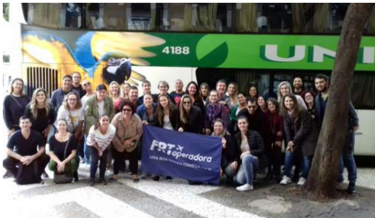
Figura 2 - Caravana Festival das Cataratas.

A rede hoteleira de Foz do Iguaçu, parceira do Festival das Cataratas, disponibilizou cortesias e tarifas especiais para os agentes de viagens, operadores de turismo e demais participantes do evento. Os Hotéis parceiros foram: Manacá, Bella Itália, Recanto Cataratas, Wyndham, Bogari, Carimã, Viale Cataratas, Tarobá, Vivaz Cataratas, Luz Hotel, Águas do Iguaçu, Continental Inn, Viale Tower, Luz Hotel, Hotel Salvatti, Hotel Alvorada, Hotel Turrance, Iguassu Holiday, Pousada Caroline e Pousada Evelina. A Figura 1 mostra uma caravana em parceria com uma operadora de viagem.