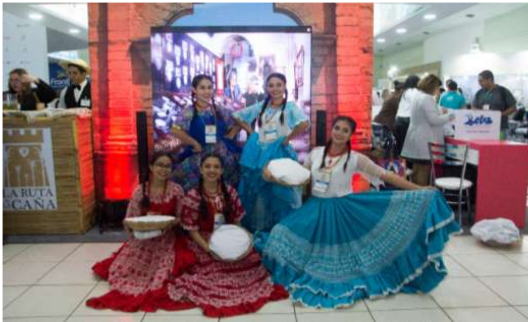
Figura 23 Apresentação de dança típica do Paraguai.