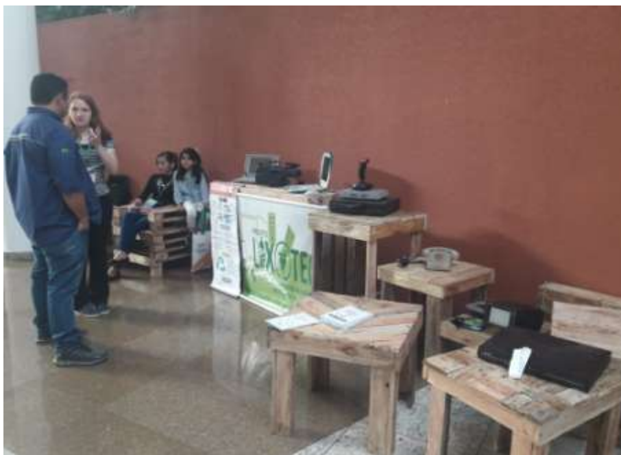
Figura 14 Exposição Museu do Lixo Eletrônico.