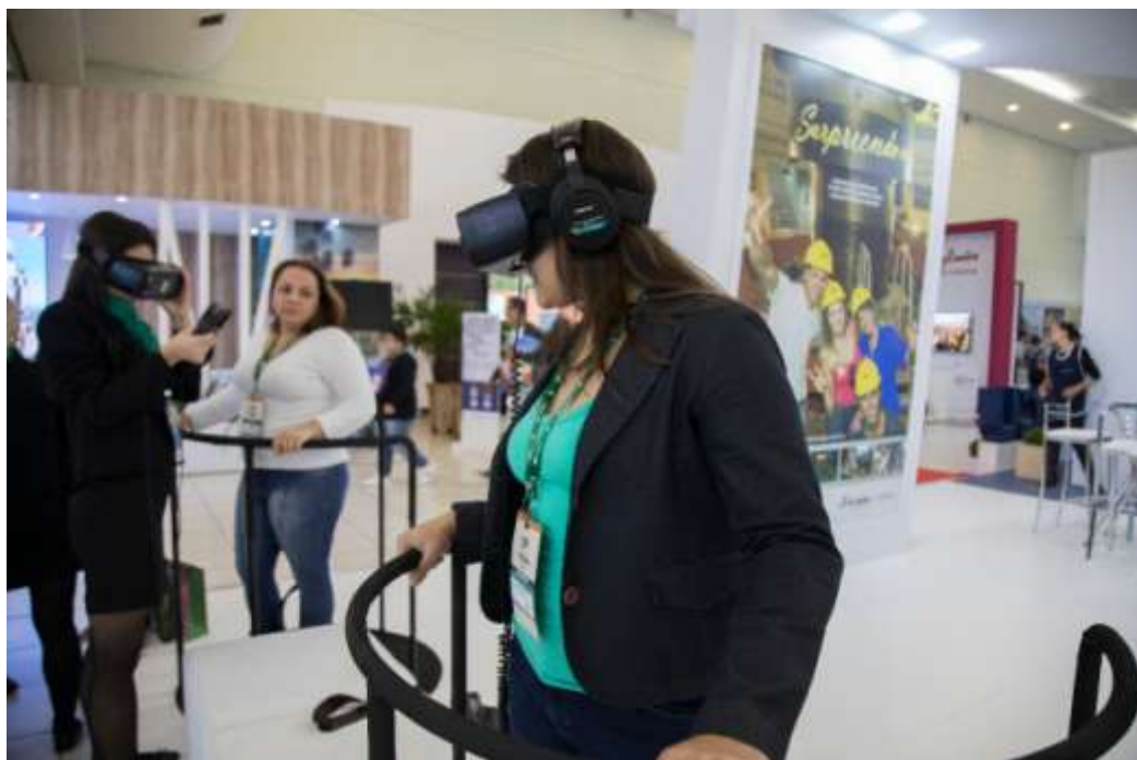
Figura 33 Realidade virtual de pontos turísticos.

O Salão E-marketing Cataratas trata-se de um espaço destinado a fomentar o turismo por meio de mídias sociais, utilizando marketing digital. São participantes efetivos desta ação influenciadores digitais e profissionais da área do turismo, com objetivos de compartilhar cases, desafios e perspectivas sobre das mídias sociais na divulgação de destinos turísticos.