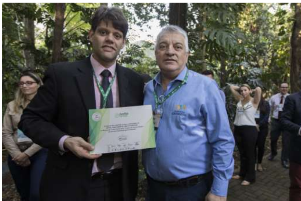
Figura 7 Entrega do certificado Junho Verde - Hotel Continental Inn.