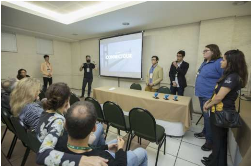
Figura 35 Apresentação projetos Hackatour.

Foram inscritos cinco projetos, o ganhador desta edição propôs uma solução para a dificuldade de encontrar informações concentradas sobre os atrativos de Foz do Iguaçu. A solução foi um aplicativo de realidade aumentada que fornece descontos aos turistas e informações sobre os atrativos, junto proporciona um meio de interação entre o ambiente e o visitante.