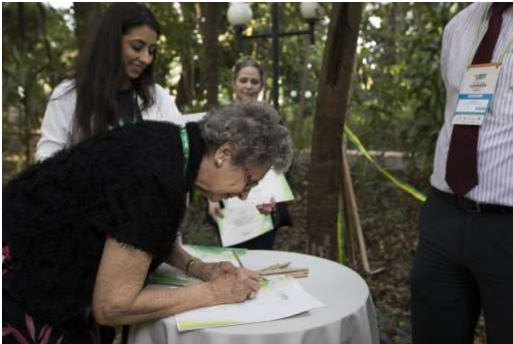
Figura 6 Assinatura Carta de Intenções - Hotel San Juan.

Festival das Cataratas visando contribuir com o desenvolvimento mais sustentável, convidou seus parceiros e empresas na área do turismo como hotéis, operadoras de turismo, atrativos turísticos, bares e restaurantes para assinarem uma carta de intenções se comprometendo em implementar ações voltadas a sustentabilidade ambiental em seus empreendimentos. Mais de vinte empresas assinaram a carta de intenções, em sua maioria, hotéis de grande impacto socioambiental de Foz do Iguaçu. Após a assinatura, foram entregues certificados de participação do Movimento Junho Verde. As figuras a seguir mostram o momento da assinatura da carta de intenção durante o Festival das Cataratas.