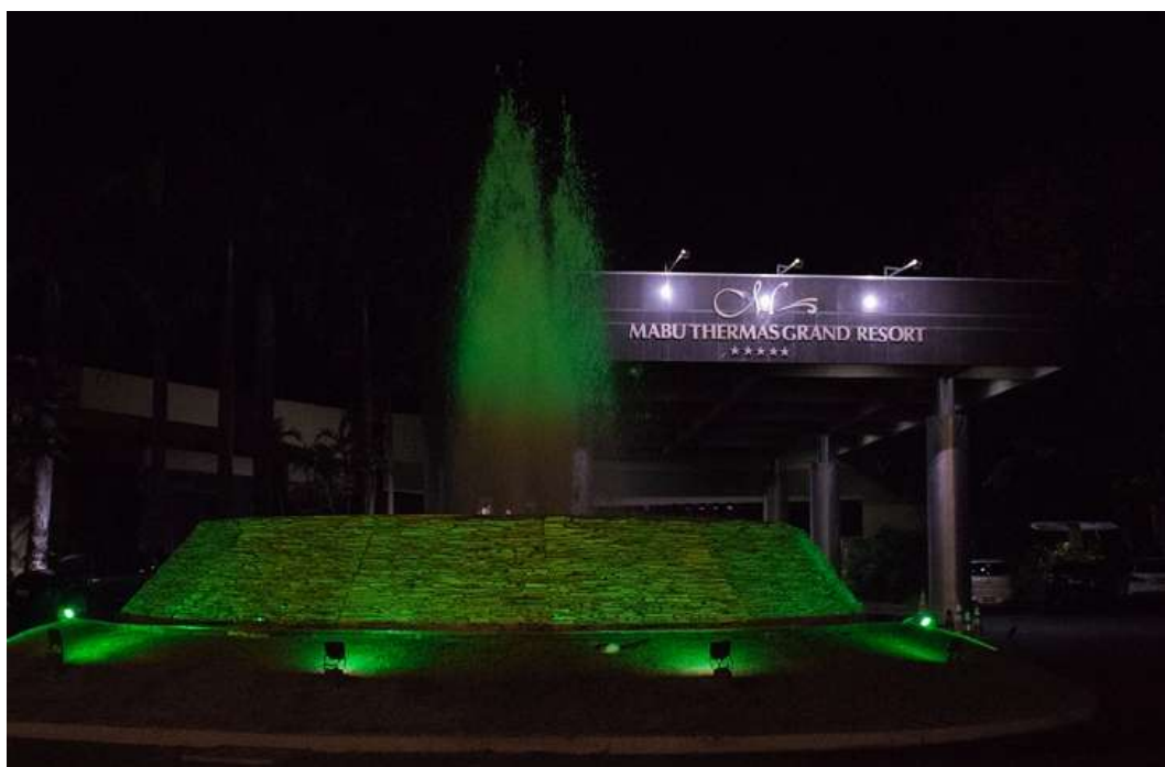
Figura 3 Iluminação Verde Mabu Thermas Grand Resort.

Com objetivo de sensibilizar a população sobre a importância da preservação ambiental, seguindo a lógica da campanha de câncer de mama, Outubro Rosa, foi realizada a ação de iluminação verde em atrativos turísticos, hotéis, bares e restaurantes, pontos turísticos, e empresas comerciais durante o mês de junho. As Figuras a seguir apresentam alguns locais iluminados em tons verdes.