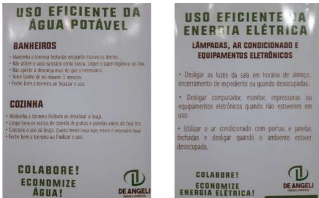
Figura 12 Placas de incentivo a redução do uso de água e energia.