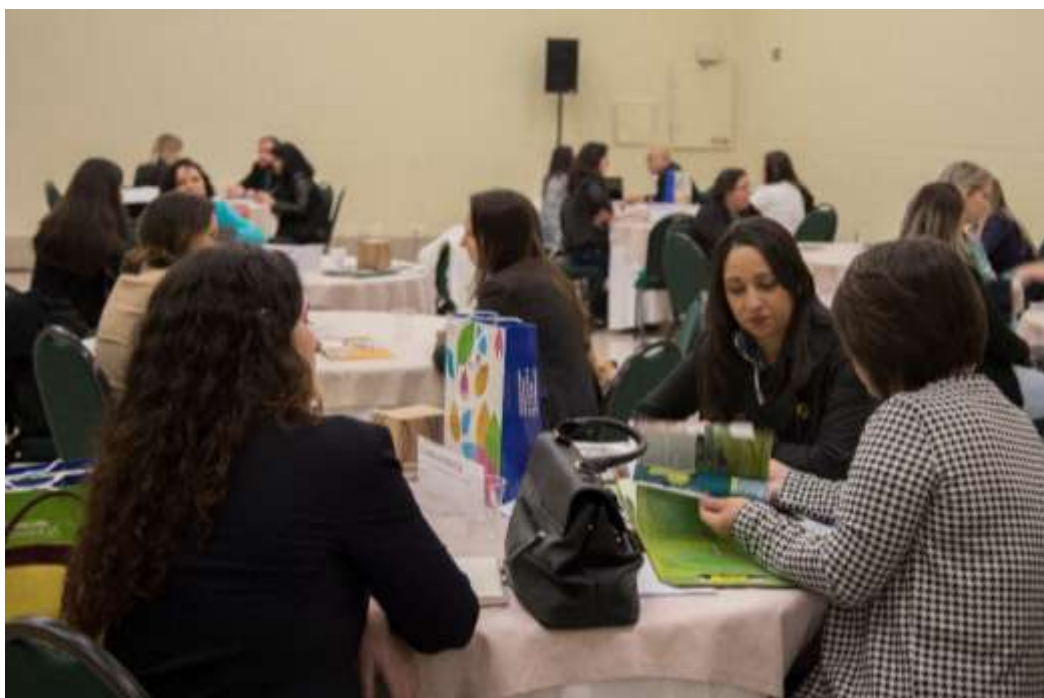
Figura 19 Rodada de Negócios.

O Festival das Cataratas incentiva por meio da Feira de Turismo e Negócios o desenvolvimento em toda cadeia produtiva do turismo, desde o pequeno ao grande empreendedor. Entre as ações desenvolvidas destaca-se a rodada de negócios, espaço destinado ao encontro e trocas de informações entre clientes e possíveis fornecedores de produtos e serviços, ampliando a rede de negócios e contribuindo o desenvolvimento econômico.