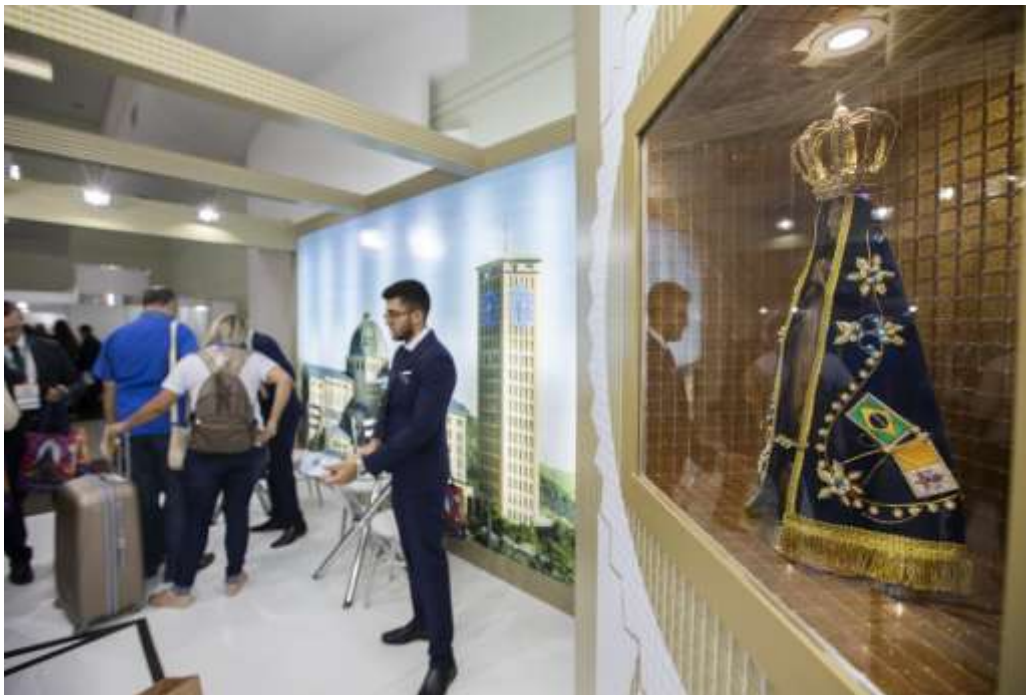
Figura 25 Exposição e representantes religiosos.