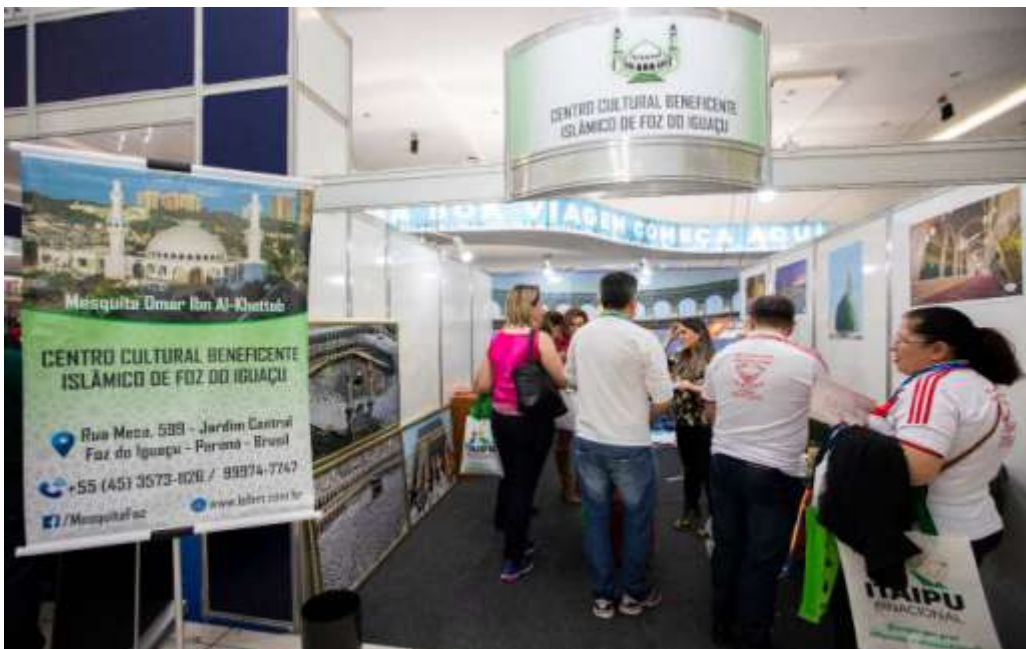
Figure 26 Exposição religiosa.