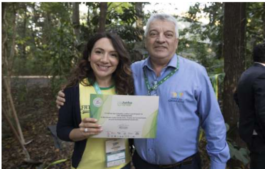
Figura 8 Entrega certificado Movimento Junho Verde - FRT Operadora.