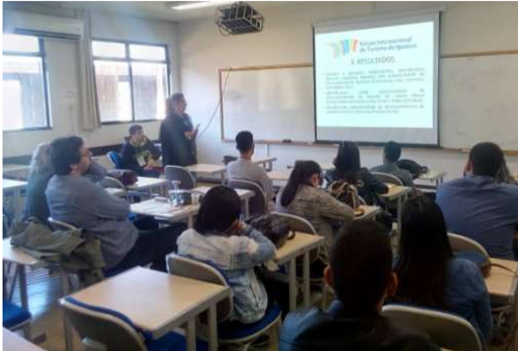
Figura 31 Apresentação de artigos científicos.