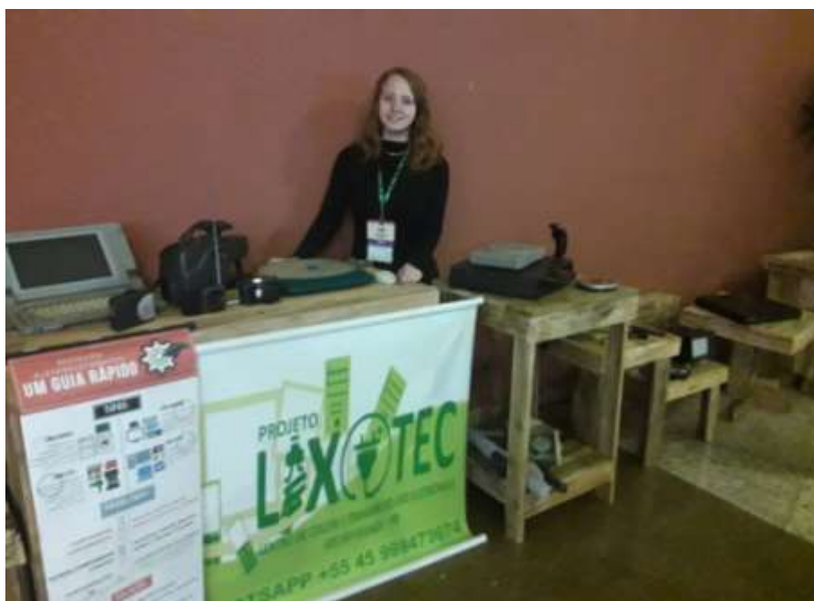
Figura 15 Participação de estudantes de Eng. Ambiental e Ciências Biológicas.