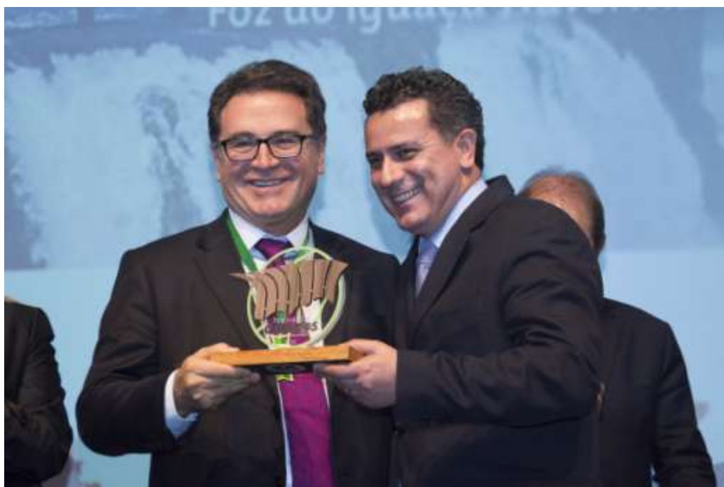
Figura 21 Troféu Amigo do Festival.

O troféu é confeccionado por artesões locais, gerando oportunidade de trabalho e renda para artesãos da região trinacional. O troféu foi idealizado em consonância com o Movimento Junho Verde. O design representa o sentido dos cuidados com a natureza, a transparência de nossas ações, a cultura com o reaproveitamento de materiais, e a modernidade com o aço escovado. Para a confecção do troféu foi utilizada madeira reaproveitada.