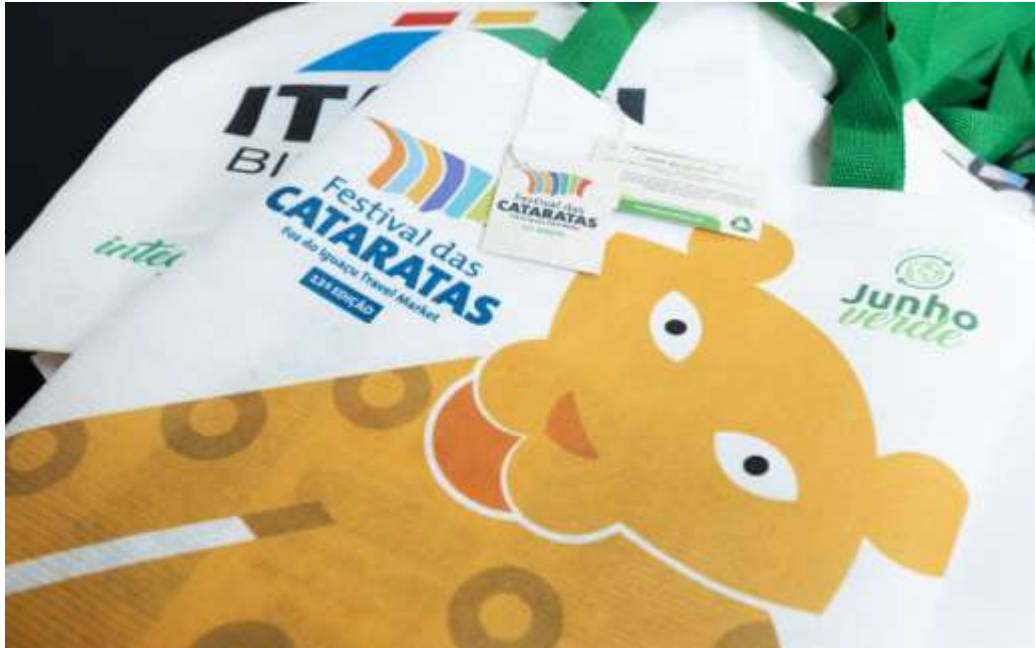
Figura 9 Bolsa confeccionada com tecido de garrafa pet.