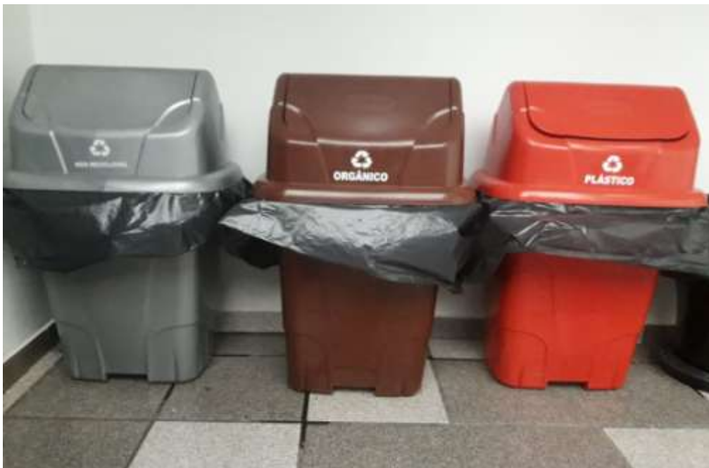
Figura 10 Lixeiras de separação dos resíduos sólidos.