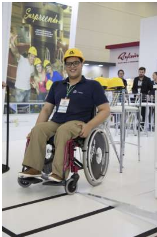
FIGURA 1 - Acessibilidade Festival das Cataratas.

O FESTIVAL DAS CATARATAS tem como princípio assegurar acessibilidade aos portadores de necessidades especiais, com intuito de se tornar mais seguro e dar oportunidades iguais para todos participantes do evento.