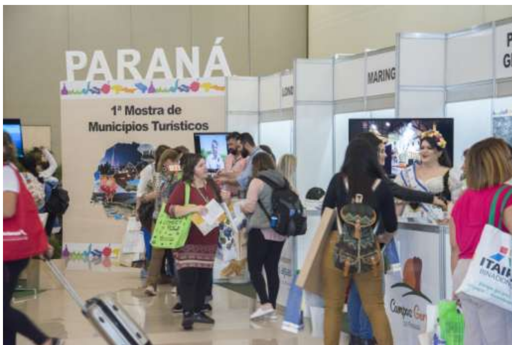
Figura 20 Mostra dos Municípios Turísticos do Paraná.

Os municípios apresentaram os seus atrativos culturais e belezas naturais, por meio de produtos turísticos e expuseram também suas especialidades em gastronomia. Em sua maioria, apresentaram e destacaram as suas festividades municipais. As Figuras a seguir exibem a Mostra dos Municípios Turísticos do Paraná.