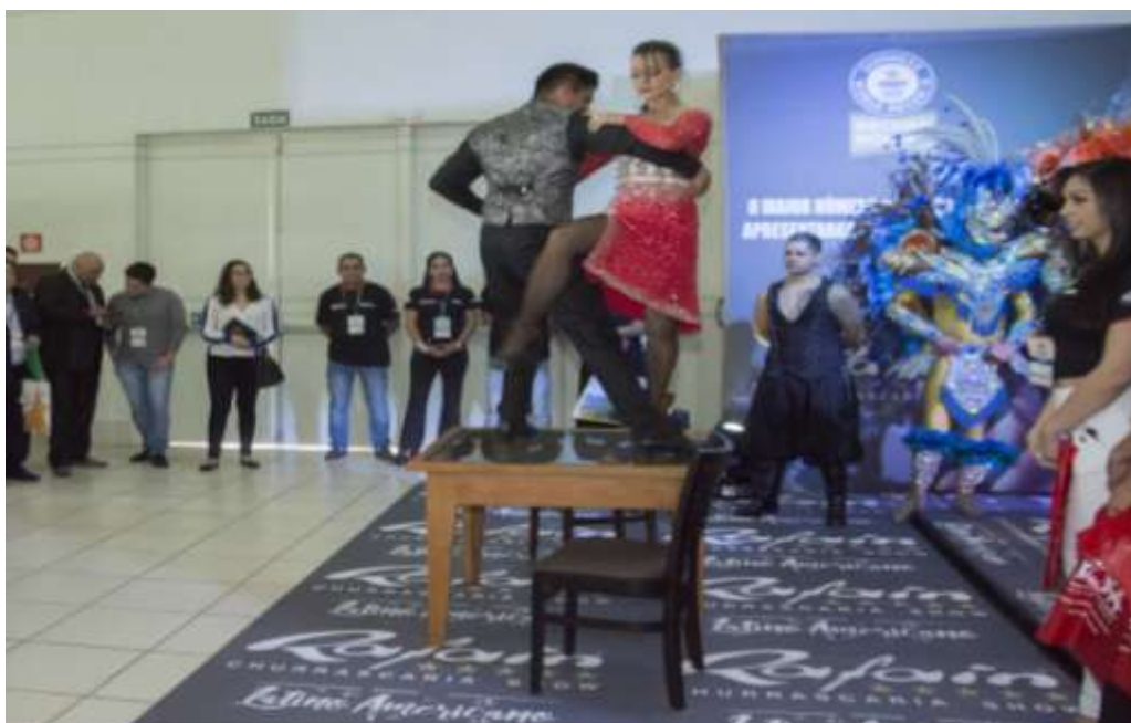
Figura 24 Apresentação Dança Tipica Argentina.