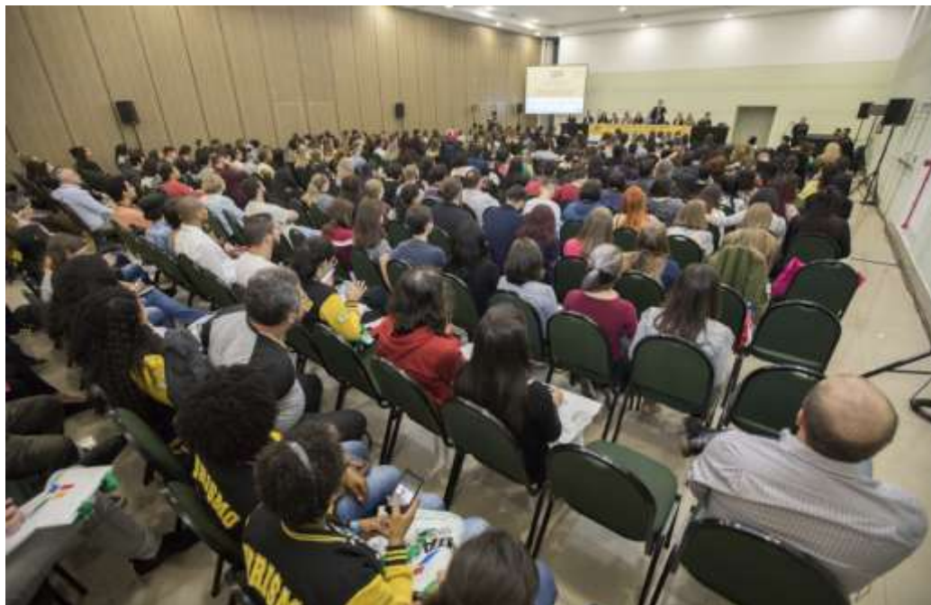
Figura 32 Palestra Fórum Internacional de Turismo Iguassu.