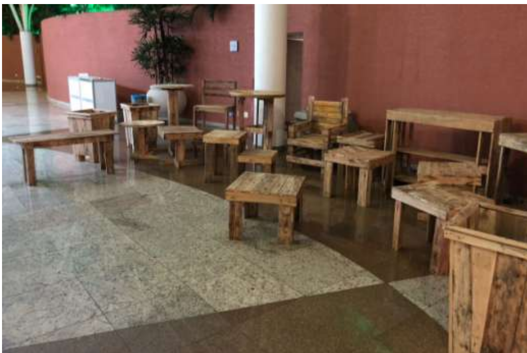
Figura 13 Exposição Projeto Móveis de Paletes.