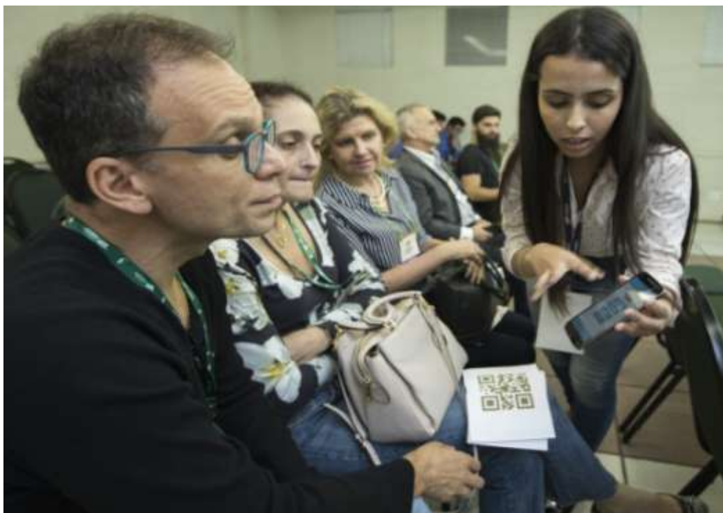
Figura 34 Aplicativo desenvolvido durante o Hackatour Carataratas.

A etapa "Acelerar" é segundo momento, esta etapa consiste no processo de aceleração dos negócios com mentoria e capacitação para levar suas soluções para o mercado. O ciclo do Hackatour termina com uma maratona de prospeção de negócios dos sistemas desenvolvidos na área do turismo.