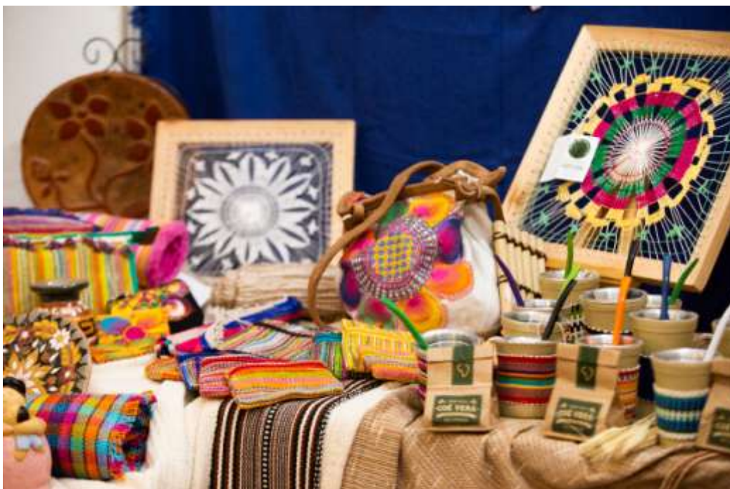
Figura 22 Exposição e venda de artigos da cultura regional.

Neste sentido, o Festival das Cataratas proporcionou espaços para a apresentação de diferentes culturas, como: exposição de artigos religiosos, apresentação de danças típicas, degustação gastronômica entre outros.