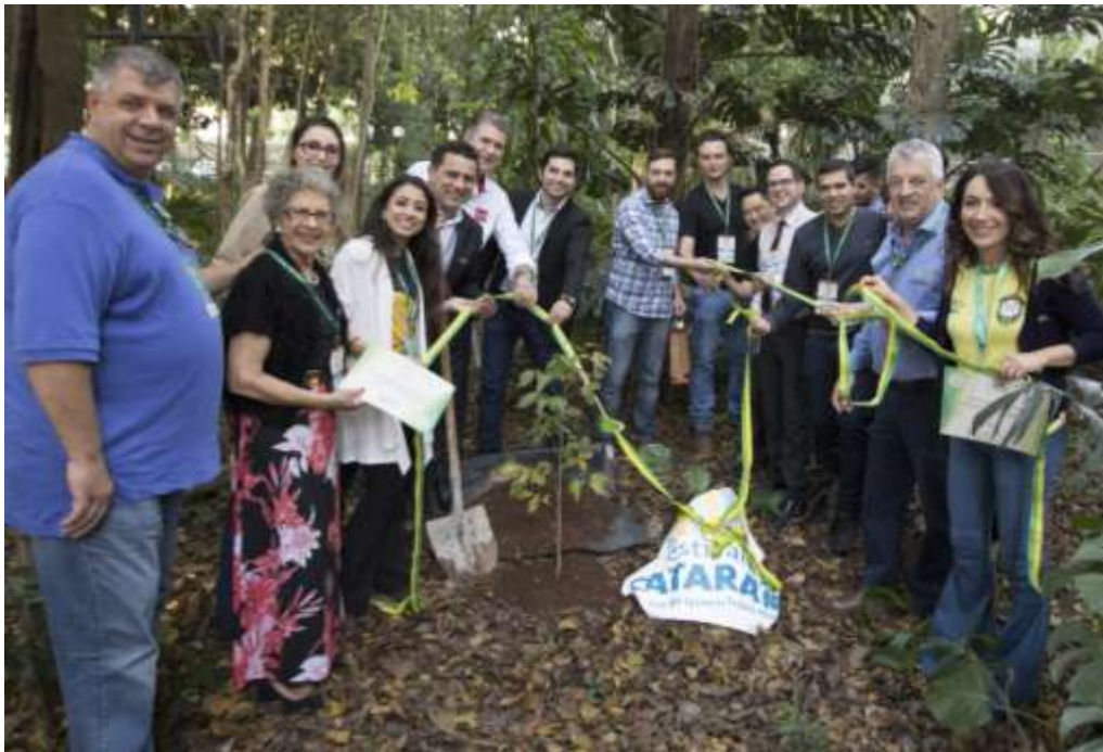
Figura 18 Plantio simbólico - compensação GEE.

Durante o Festival das Cataratas 2018, foi realizado o plantio de uma muda de árvore nativa, Ipê Roxo, considerada popularmente como árvore símbolo de Foz do Iguaçu, em conjunto com as empresas que participaram do Movimento Junho Verde simbolizando o plantio da compensação GEE de 2018.