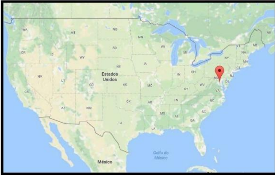
MAPA 01: Localização da Capital Washington (Estados Unidos)