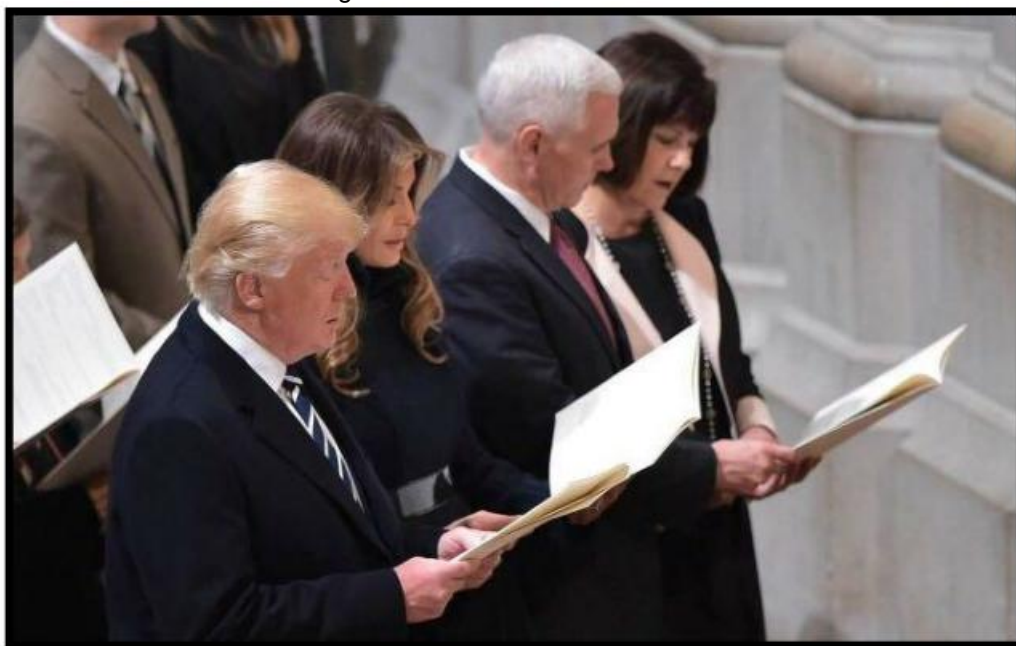
IMAGEM 05: Donald Trump (2017) presente em cerimônia religiosa após sua eleição em 21 de Janeiro de 2017 em Washington DC.

Segundo o portal online oficial (2017) da Catedral, durante anos são realizados cerimônias religiosas em que há a presença de recém presidentes americanos (imagem 05). Durante uma observação in loco em 21.01.2017 foi possível constatar a presença do presidente Donald Trump após sua posse da presidência Americana.