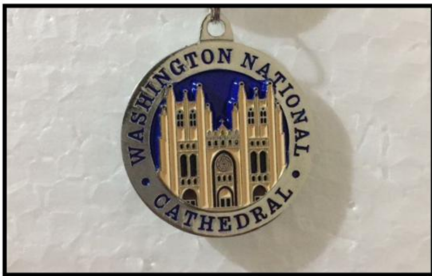
IMAGEM 04: Survenier comercializada no atrativo.

No local estudado é possível a aquisição de surveniers , relacionadas ao atrativo como turístico religioso, como por exemplo, chaveiros que remetem a imagem do atrativo (imagem 04), água benzida, crucifixos, terços, imagens, entre outros.