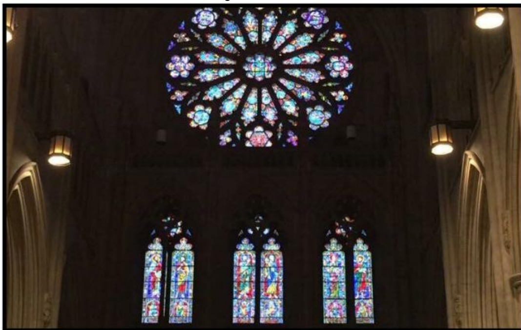
IMAGEM 04: Vitrais e arcos em estilo gótico.

Outros elementos são encontrados na estrutura, que compõe o estilo gótico de construção, como podemos observar na imagem 04, tais como 215 vitrais que compõem a catedral, de acordo com o site oficial (2017).