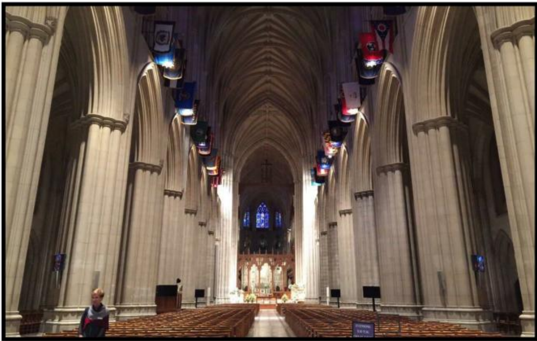
IMAGEM 02: Interior da Catedral Nacional de Washington DC.

A Catedral Nacional de Washington (imagem 02) tem potencial para apreciação devido sua riqueza em detalhes, possuindo, segundo site oficial (2017) peso de 150.000 toneladas; 112 gárgulas; 676 pés de altura das torres principais acima do nível do mar (entorno de 206 metros), tornando assim o ponto mais alto da região de Distrito de Columbia.