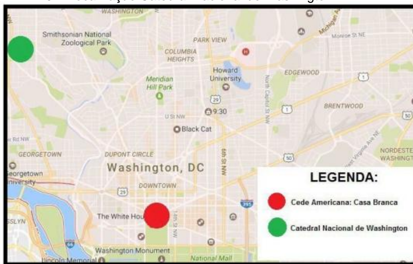
MAPA 02: Localização Catedral Nacional de Washington.